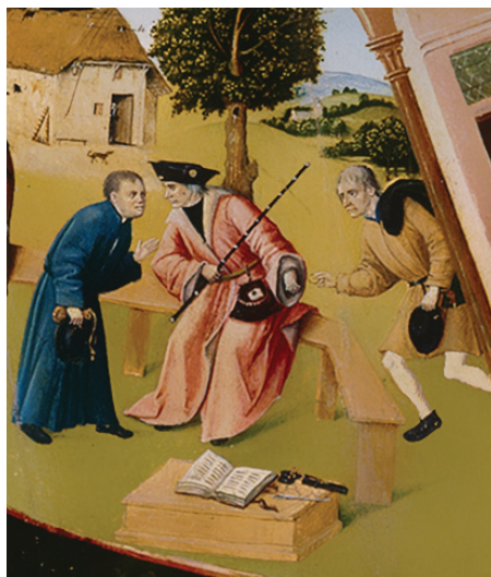
Фрагмент «Алчность» картины Иеронима Босха «Семь смертных грехов»

Рассматривая участников коррупции на примере взяточничества, стоит отметить, что в коррупционном процессе всегда участвуют две стороны. Одна сторона — это взяткополучатель (подкупаемый). Вторая сторона — это взяткодатель (осуществляющий подкуп). Также в процессе может участвовать и третья сторона — посредник.