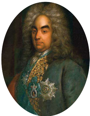
Петр Андреевич Толстой