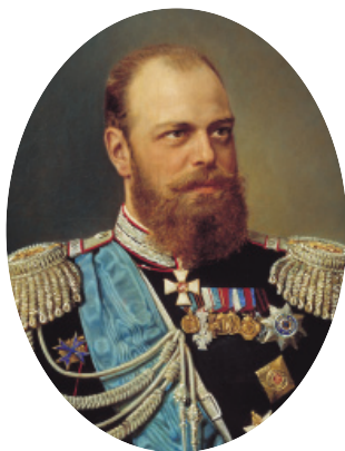
Император Александр III