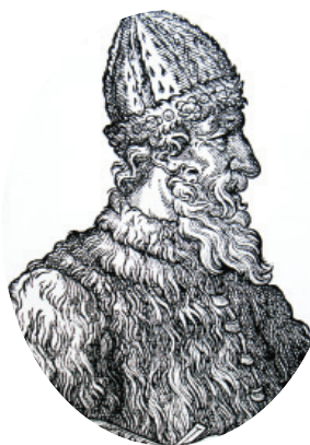
Великий князь Иван III

До XVIII века чиновники на Руси жили благодаря так называемым «кормлениям», то есть, при отсутствии оклада за исправление должности, разрешению на подношения от заинтересованных в их деятельности лиц. Одаривали их не только деньгами, но и «натурой» — мясом, рыбой, пирогами и пр., что было делом обыкновенным.