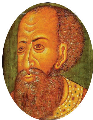
Царь Иван IV Грозный