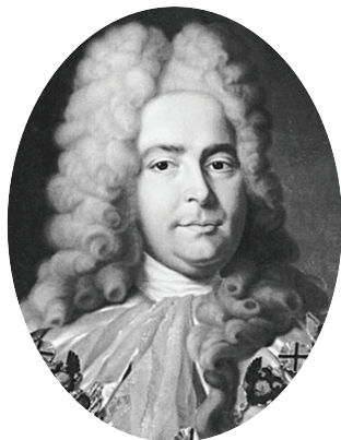
Генерал-прокурор Павел Иванович Ягужинский