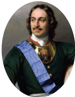
Император Петр I

Сообщениями «о похищении казны» первоначально занималась тайная канцелярия во главе с графом П.А. Толстым. И работала она на совесть. Но были и такие дворяне и чиновники, которые к проблеме мздоимства относились гораздо терпимее. По рассказам современников, однажды в Сенате Петр пригрозил издать указ, по которому всякий, кто украдет у казны сумму, на которую можно купить веревку, будет повешен. Генерал-прокурор Ягужинский на это заметил: «Неужели вы хотите остаться императором без служителей и подданных? Мы все воруют — с тем только различием, что один больше и приметнее, чем другой».